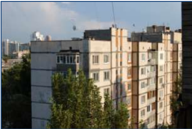
Bostadsområdet i Kiev

Här, mitt i vardagsmissnöjet och politiker-sveken bor vi , jag och nio andra studenter från Europas alla hörn. Kvarterets sextonvåningshus är nedgångna och färgen på fasaderna har säkerligen inte bättrats på sedan sovjettiden. På innergården planterar bushkorna blommor och odlar en och annan grönsak, barnen åker inlines på den knögliga asfalten och gubbarna dricker öl på en bänk i skuggan. Det är ett levande bostadsområde, och jag trivs mycket bra.